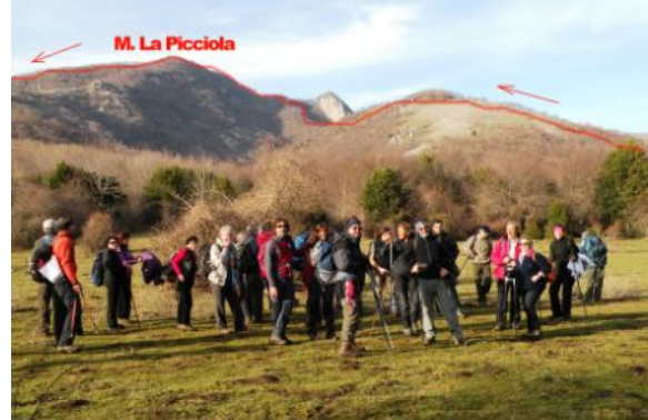
Piano di Montenero

un percorso di cresta, raggiungeremo la cima del Monte La Picciola a quota 1524. Per il ritorno ci serviremo del sentiero 154-B, che ci permetterà di fare tappa al piano di Montenero e da qui all'eremo di San Michele. Poi percorrendo una comoda sterrata faremo ritorno al piano Canale e al rifugio, punto della nostra partenza.