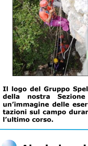
Il logo del Gruppo Speleo della nostra Sezione e un'immagine delle esercitazioni sul campo durante l'ultimo corso.